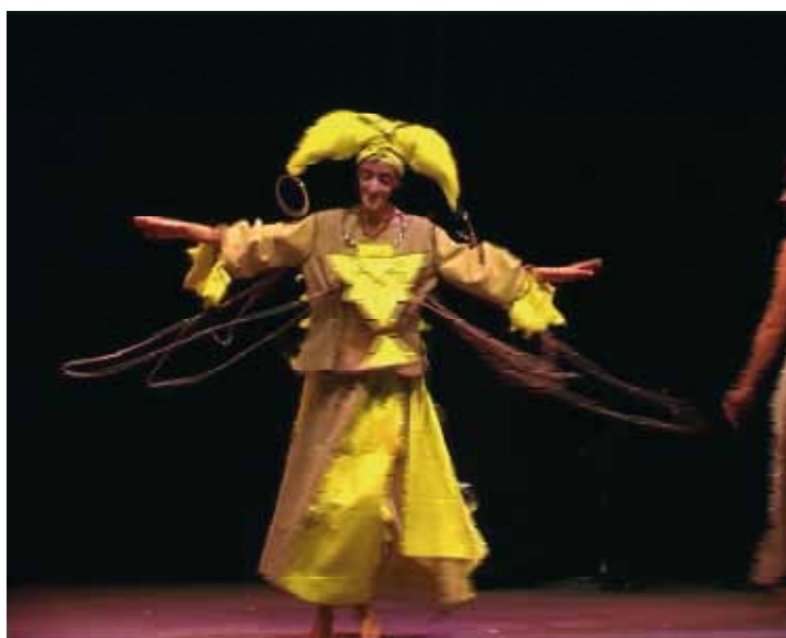
Défilé Strasbourg Méditerranée - décembre 2005

L'objectif est de reconduire les emplois d'au moins une partie des femmes par l'intermédiaire d'un second CDD en vue de la fabrication en série et d'accompagner les autres vers la recherche d'un emploi en relation avec le secteur de la mode, soit sous statut indépendant, soit en tant que salarié à temps plein ou partiel.