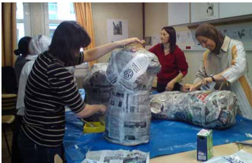
Atelier de la Cité des Ecrivains - mars 2012

Le nom de la marque « sera « Première ligne » et celle-ci aura pour clientèle cible les plus de 25 ans, avec une gamme de prix entre 30 et 150 euros environ.